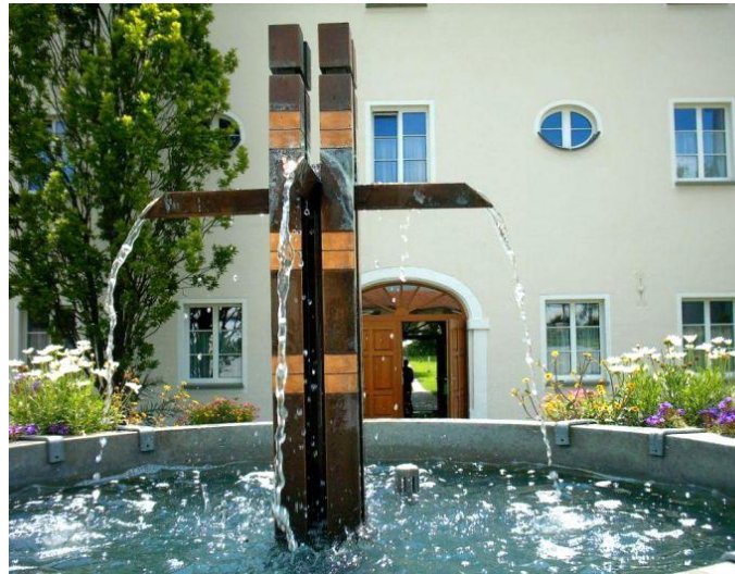
Brunnen vor dem Jugendhaus St. Elisabeth, Kloster Sießen